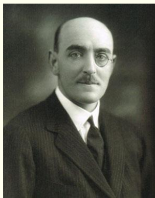
Sir Herbert Cayzer

La CLAN LINE fu fondata nel 1877 a Liverpool con il nome di C.W. CAYZER – IRVINE & CO. con linee commerciali marittime fra Regno Unito e India.