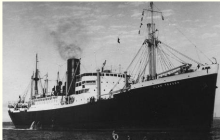
CLAN FRASER (III) DEL 1961

La vidi ormeggiata a metà degli anni 60 al molo del Carmine del porto di Napoli che scaricava una gran quantità di quarti di manzo congelato. E' un ricordo ancora ben vivo nella mia memoria di giovanissimo studente del Nautico.